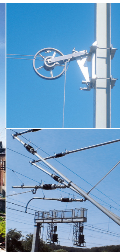
◀ RIBE® Radspanner mit integrierter Seilbremse – für bruchfreies Abbremsen